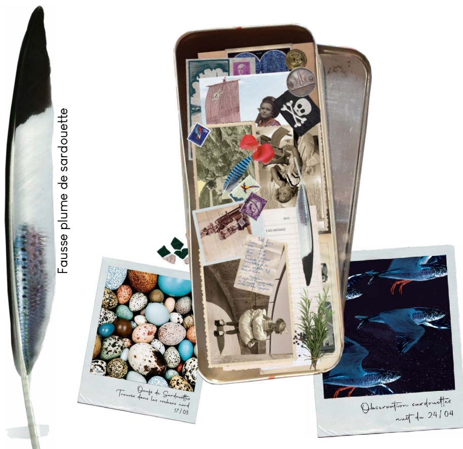
Groupe de Sardouettes Trouvées dans les rochers nord 17/03